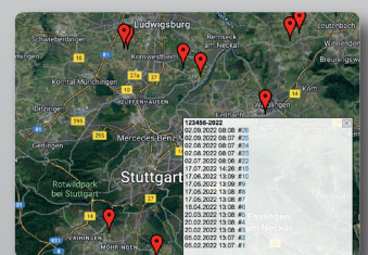
Geolokalisierung der Pressorte